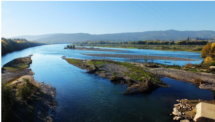
Figura N° 5 Río Mataquito, Hualañé.