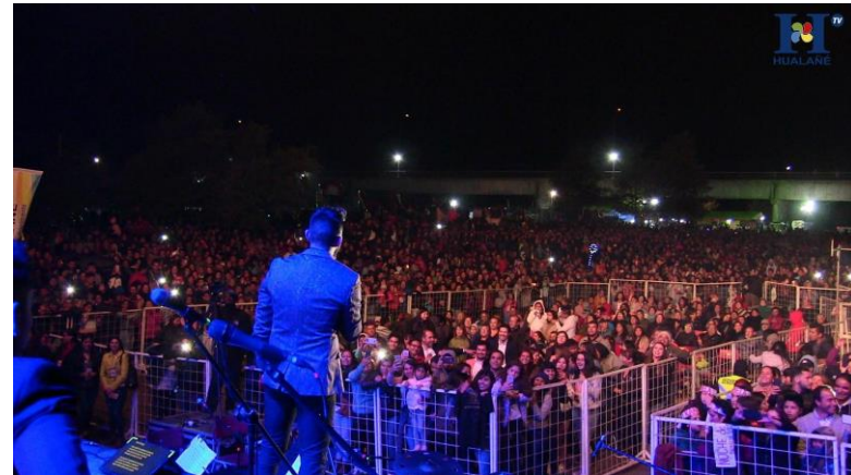
Figura N° 8 Festival “La Voz del Mataquito”, Hualañé.

En febrero se realiza el festival de la canción “La Voz del Mataquito”, el cual reúne una variada parrilla artística nacional. A su vez en este festival, se lleva a cabo una competencia en donde concursan folcloristas y cantautores de la comuna y la zona.