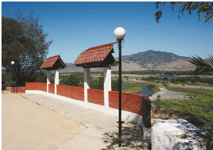
Figura N° 1 Mirador de la Huerta, Hualañé.

Está ubicado en la entrada oriente de la comuna, en la localidad de La Huerta. Este lugar dispone de espacio amplio para detenerse a observar el río Mataquito y su avifauna. En el lugar se pueden estacionar perfectamente los vehículos ( https://bit.ly/2Xz4MtE ).