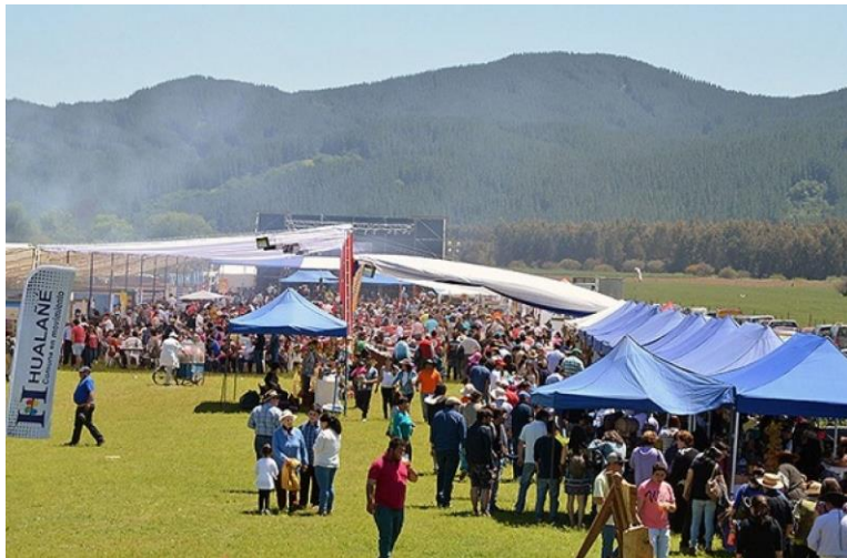
Figura N° 9 Fiesta Costumbrista Ruta del Cordero, Hualañé.

Se realiza en el mes de octubre o principios de noviembre en la localidad de Los Coipos. En dos días de celebración, se presenta una muestra gastronómica convocando a diversas cocinerías, con preparaciones de cordero y otras alternativas gastronómicas, además de puntos con venta de productos locales y artesanía ( https://bit.ly/2RFn6O5 ).