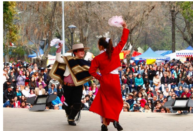
Figura N° 7 Fiesta de la Chilenidad, Hualañé.

Con un bello paisaje de campo al aire libre, se instala una ramada que da cobijo a los asistentes que llegan a degustar diversos platos típicos. Cerca del mediodía los huasos se acercan a la zona preparada para participar de juegos que apuntan al manejo del hombre sobre su bestia, la silla musical a caballo, destrezas de los jinetes y otras maniobras que dan un espectáculo entretenido a los visitantes. El mejor evaluado es premiado al finalizar la jornada ( https://bit.ly/2Xz4MtE ).