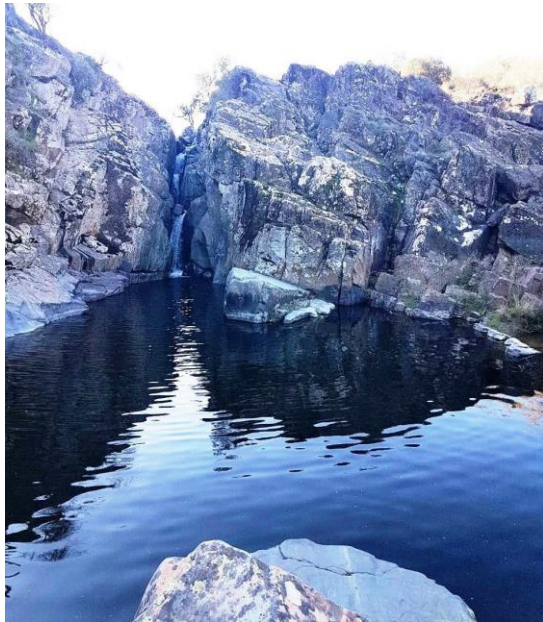
Figura N° 3 Laguna El Morro, Hualañé

determinar su profundidad, sin obtener resultados, pero si alguien quizás lo consiga, puede que no tenga retorno a la superficie ( https://bit.ly/2Xz4MtE ).