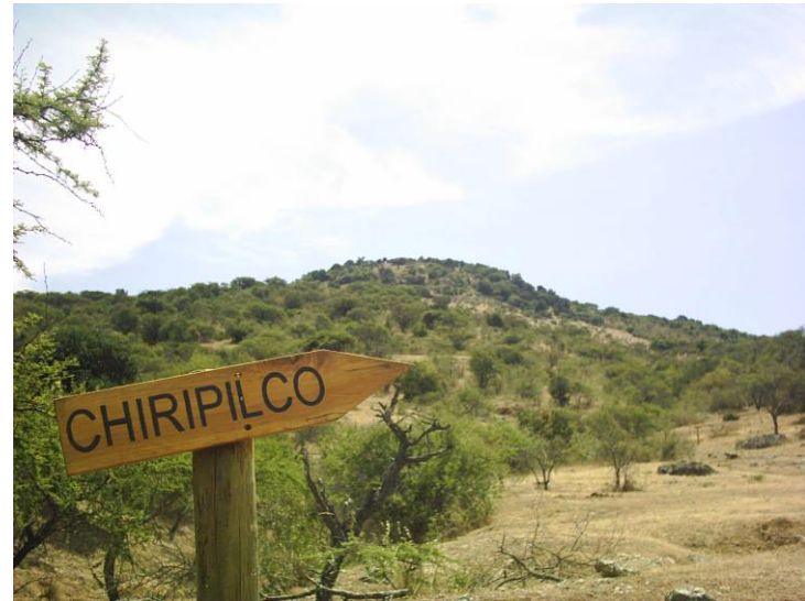
Figura N° 6 Cerro Chiripilco, Hualañé

mapuches que se reúnen en lo empinado del cerro para conmemorar dicho acontecimiento ( https://bit.ly/2Xz4MtE ).