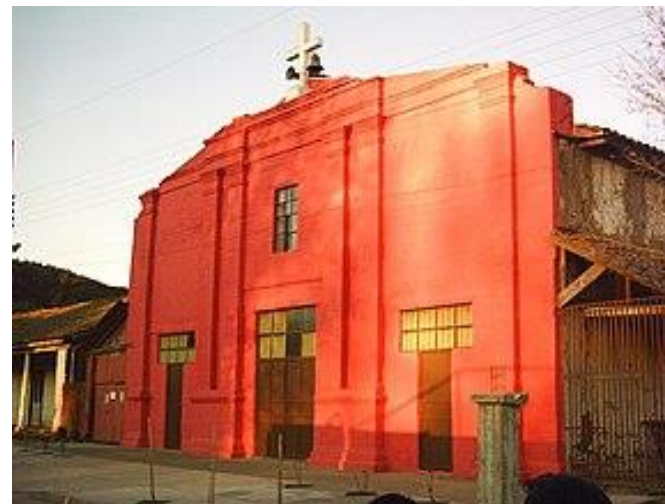
Figura N° 2 Parroquia San Policarpo, Hualañé.

Esta parroquia está ubicada en la localidad de La Huerta, a 19 kilómetros oriente de Hualañé urbano. Fue construida a base de adobe, vigas y piso de madera de roble., Según el libro de registro de nacimientos existente en la parroquia, el edificio data del año 1930 ( https://bit.ly/2Xz4MtE ).